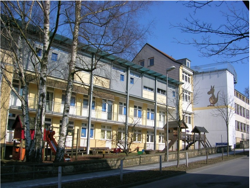
Kinder- und Jugendmedizinischen Klinik Detmold